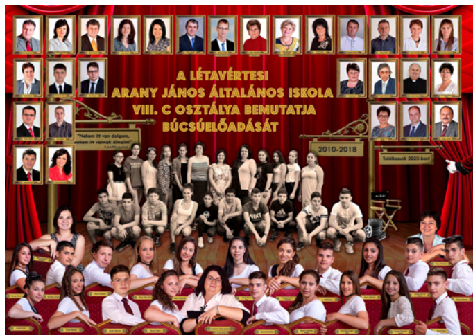
Arany János Iskola 8. c osztály

A tablóképek színesben, nagyobb méretben: www.letavertes.hu /Település/ Oktatás / Iskolák oldala – Fotók: Boros – Szima Beáta