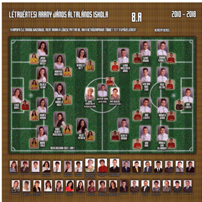
Arany János Iskola 8.a osztály