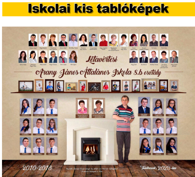
Arany János Iskola 8. b osztály