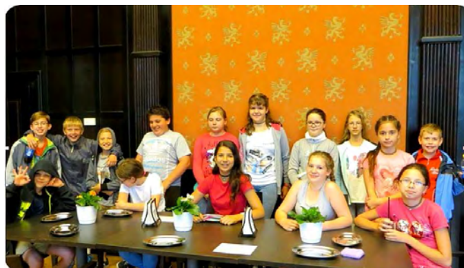
Tiszadobon az Andrassy kastélyban

Az 5.a osztály Tiszadobon az Andrassy kastélyt tekintette meg. Tiszalökön a Holt Tiszára épült tanösvényen ismerkedtek a növény és állatvilággal, és megnézték a vízierőművet is. Tarcal és Tokaj természeti adottságait csodálták és még hegyet is másztak.